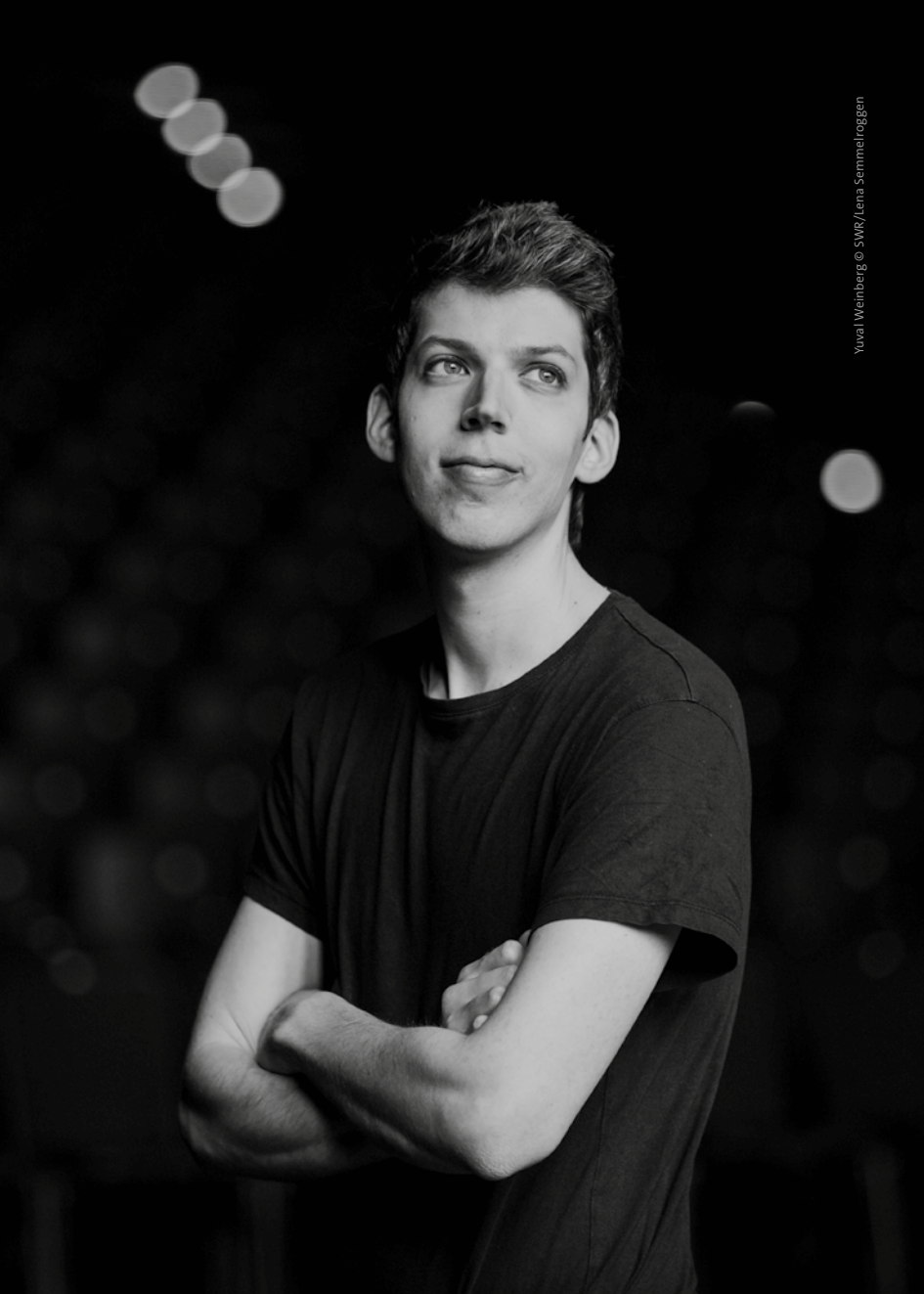
Yuval Weinberg © SWR/Lena Sammel/oggen