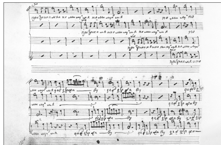
Artem Vedel, Konzert für Chor, Manuskriptseite. Institut für Manuskripte der Nationalbibliothek der Ukraine Vernadsk

Über die Jahrhunderte hinweg nimmt die Bedeutung von Bortniansky für Russland ab. Besonders nach dem Erwachen der nationalen russischen Komponistenschule im 19. Jahrhundert ruft sein klassisch-kosmopolitischer Stil Unbehagen hervor; als »schwaches Echo der Italiener auf die Musik der Mozartzeit« wird er bezeichnet. Zwar ediert kein Geringerer als Tschaikowsky die Gesamtausgabe seiner geistlichen Werke, doch mehr aus finanziellen Gründen denn aus Bewunderung. Tschaikowskys Haltung spiegelt den damaligen Wunsch nach einer nationalen, russischen Musik wider – nach Identifikation, die in der italienisch anmutenden Musik Bortnianskys nicht zu finden ist. Er schreibt: »Ich bemerke die Verdienste von Bortniansky, [...] aber wie wenig harmoniert [seine] Musik mit dem byzantinischen Stil der Architektur, Bilder, mit dem gesamten Gefühl des orthodoxen Gottesdienstes!« Und doch begeistert sich Tschaikowsky für die Gattung der Geistlichen Konzerte und drückt sich gegenüber einzelnen Werken beeindruckt aus: wie Bortnianskys Konzert Nr. 32, an dessen Ende ein ausgedehnter fugierter Satz steht, der den Widerstand gegen den Tod beschreibt.