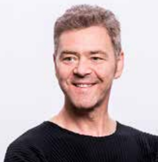
MIKHAIL SHASHKOV GENERAL BASS