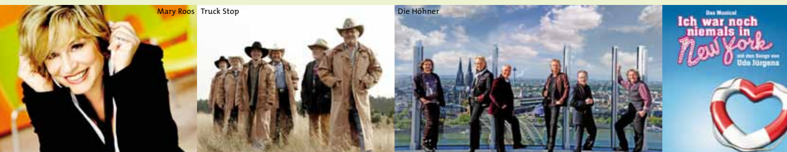
ab 18. November im Apollo Theater Stuttgart

Markt der Regionen präsentieren. Genießen Sie die Auftritte Ihrer großen Schlagerstars und freuen Sie sich auf viele musikalische Höhepunkte auf der Hauptbühne. Lassen Sie sich von den Mundartkünstlern auf der »Vier Vergnügen«-Bühne begeistern und verbringen Sie einen wundervollen Tag mit SWR4.