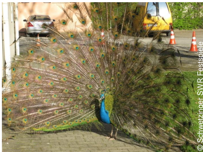
Pfau im Schwetzingen Schlosspark

der Frühling hat Einzug gehalten im Schwetzingen Schlosspark und mit ihm das Festspielbüro der Schwetzingen SWR Festspiele. Passend dazu haben auch die Pfauen im Park ihr Festtagsgewand angelegt und präsentieren sich den Besuchern in ganzer Pracht. Der Countdown für die Eröffnung der Festspielsaison 2011 läuft. Im Rokokotheater wird das Bühnenbild für die erste Opernproduktion aufgebaut, mit Spannung wird die Uraufführung von Georg Friedrich Haas' Oper „Bluthaus“ am 29. April erwartet.