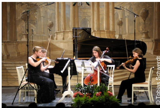
Stipendiaten bei der „Lange Nacht im Rokokotheater“

7. Mai, 20 Uhr, Rokokotheater Lange Nacht im Rokokotheater Kammermusik verschiedener Komponisten und Epochen