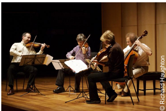
Das Takács Quartet beim Proben