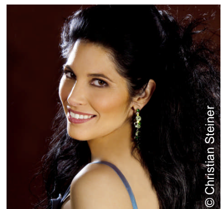
Versprüht barocke Koloraturfunken: Vivica Genaux