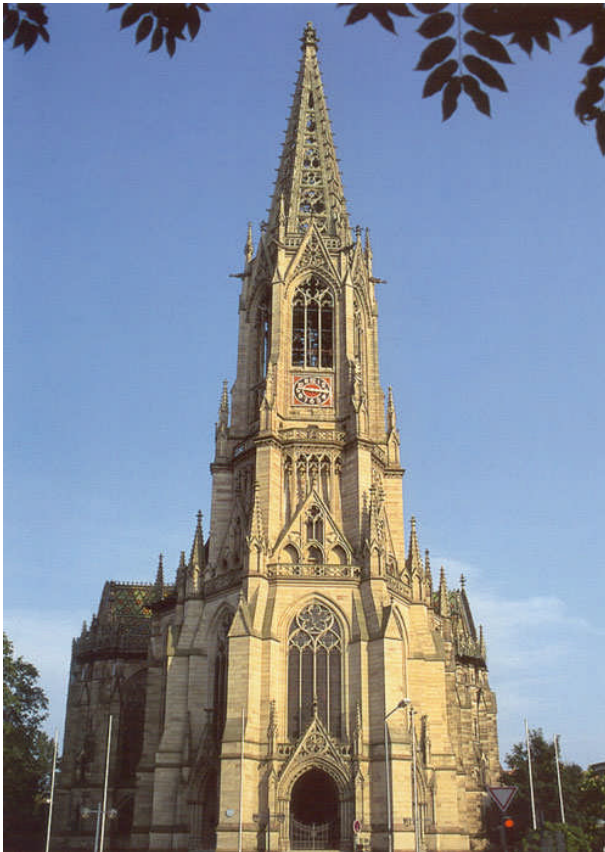
Nach dem Vorbild der Wiener Votivkirche: Die Gedächtniskirche in Speyer