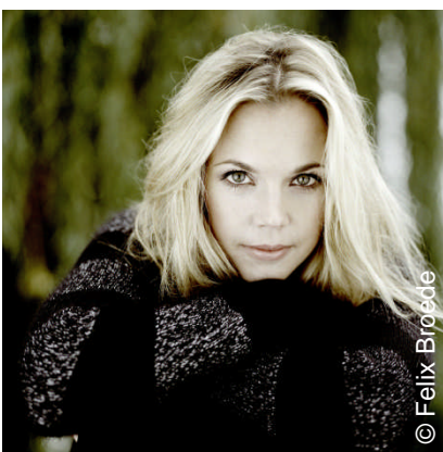
Stammgast in Schwetzingen: Mojca Erdmann