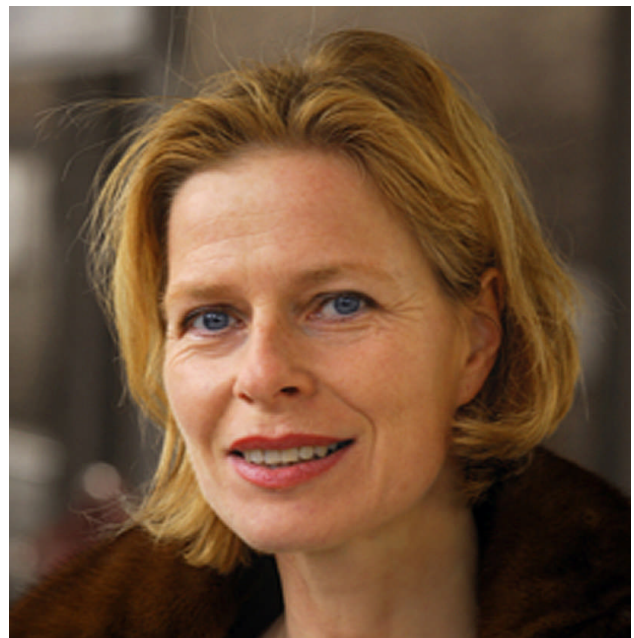
Corinna Kirchhoff liest aus Adalbert Stifters „Brigitta“

Die Preisträgerin der Montreal International Musical Competition 2008 wird besonders für ihr Liszt-Spiel hoch gelobt. Corinna Kirchhoff gilt als eine der führenden Schauspielerinnen der Gegenwart. Seit ihrem Theaterdebüt 1983 in Tschechows „Drei Schwestern“ an der Berliner Schaubühne unter Peter Stein, spielte sie regelmäßig an zahlreichen deutschsprachigen Bühnen, darunter das Burgtheater Wien, das Schauspielhaus Zürich und die Berliner Schaubühne. Auch in verschiedenen Film- und Fernsehproduktionen wirkte sie mit, zuletzt in Tom Tykwers Film „Drei“, der aktuell im Kino zu sehen ist. Neben Auftritten in Film, Fernsehen und auf der Theaterbühne, liegt Corinna Kirchhoff auch die Lyrik sehr am Herzen. So wirkte sie neben zahlreichen weiteren renommierten Künstlern beim vom SWR und Radio Bremen für die ARD produzierten „Hör-Conrady“ mit, einem Hörbuch-Lyrik-Projekt, das knapp 1100 Gedichte aus rund 900 Jahren von mehr als 460 Dichterinnen und Dichtern auf 21 CDs, gesprochen von der deutschen Schauspiel-Elite, in sich vereint.