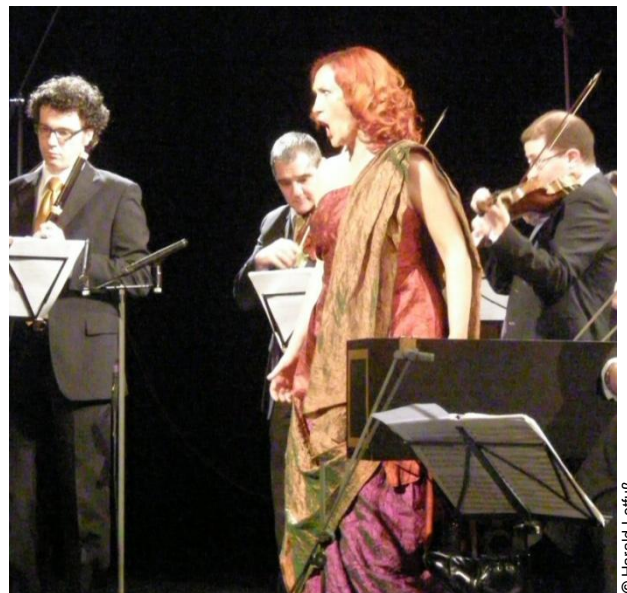
Simone Kermes und das Venice Baroque Orchestra