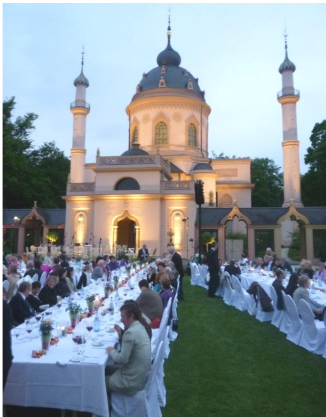
Die festlich gedeckte Tafel beim „Fest im Serail“ im Moscheegarten des Schwetzingen Schlossparks

knapp fünf Wochen nach der Cena Ultima, dem rauschenden Abschlussfest der Schwetzingen SWR Festspiele, präsentieren wir Ihnen einige resümierende Eindrücke von der Festivalsaison 2010 und eine Auswahl an Pressestimmen zu den diesjährigen Konzerten. Außerdem weisen wir Sie auf die noch bevorstehenden Sendungen im Zusammenhang mit den Festspielen hin und geben Ihnen eine erste Vorschau auf die kommende Saison.