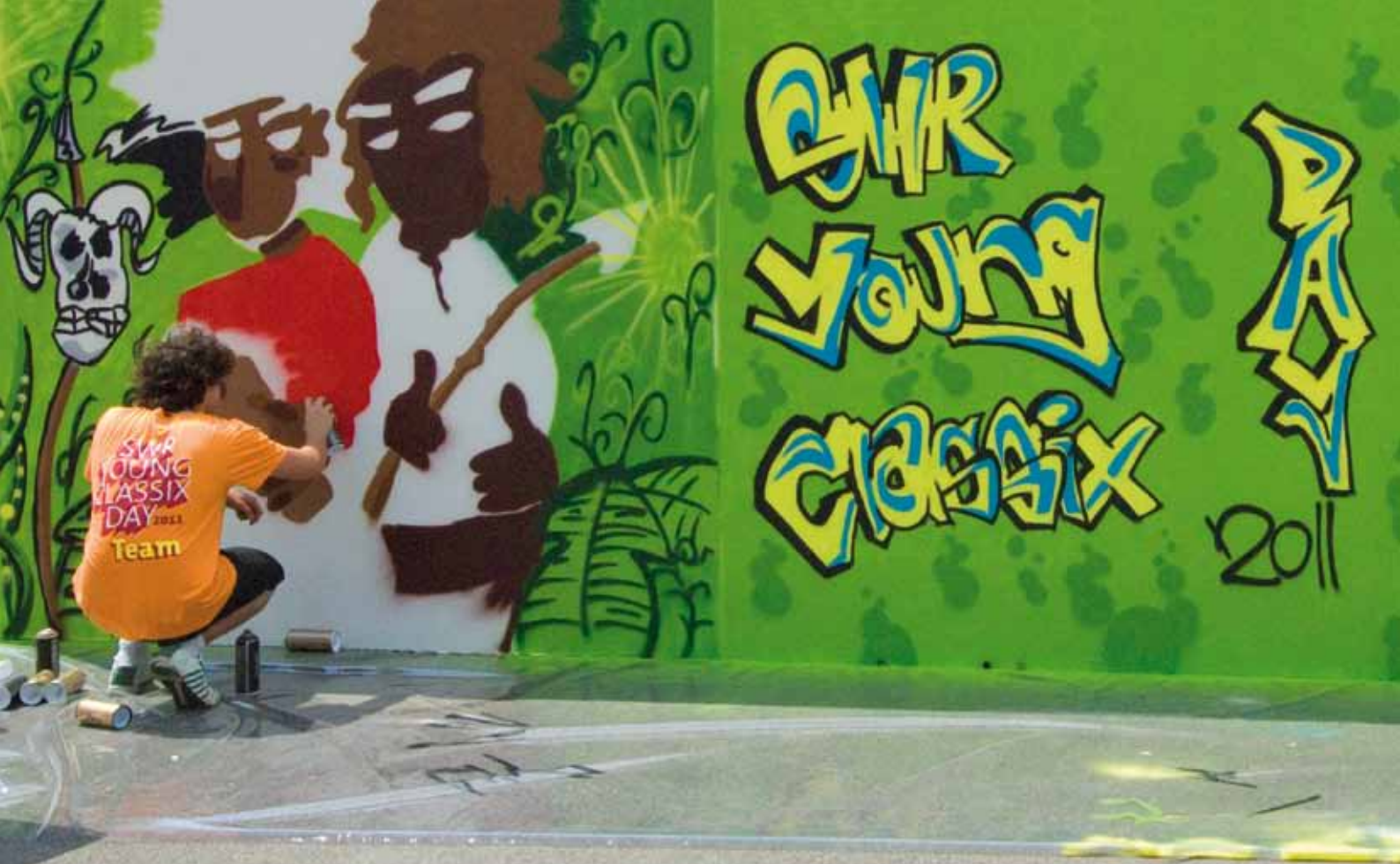
Sprays auf klassische Musik beim ersten SWR Young CLASSIX Day