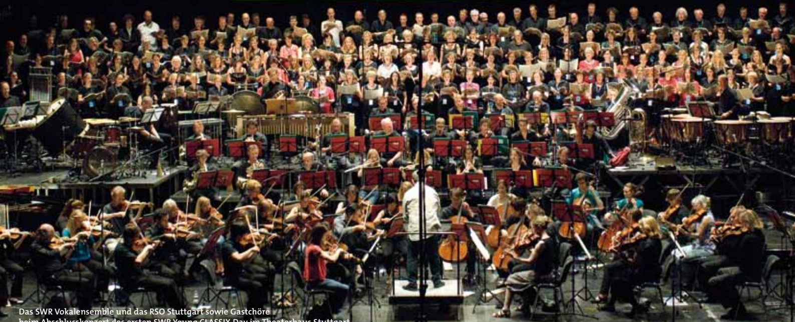
Das SWR Vokalensemble und das RSO Stuttgart sowie Gastchöre beim Abschlusskonzert des ersten SWR Young CLASSIX Day im Theaterhaus Stuttgart