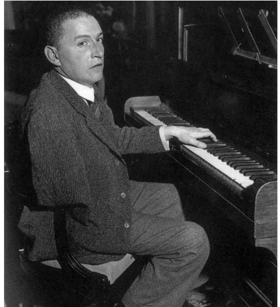
Der Pianist Paul Wittgenstein (1887–1961)

Obwohl er 1929 bereits geraume Zeit an einem regulären Klavierkonzert arbeitete, hatte Ravel Wittgensteins Offerte angenommen. Vielleicht war es für ihn reizvoll und befruchtend – neben allen äußerlichen Gesichtspunkten –, an zwei ganz gegensätzlichen Werken einer Gattung nebeneinander zu komponieren. So lagen zwei Stapel Notenpapier auf den beiden Seiten seines Flügels – einer in G-Dur und jener in D-Dur für das Wittgenstein-Konzert – und damit auch zwei Klavierwelten. Während das G-Dur-Konzert