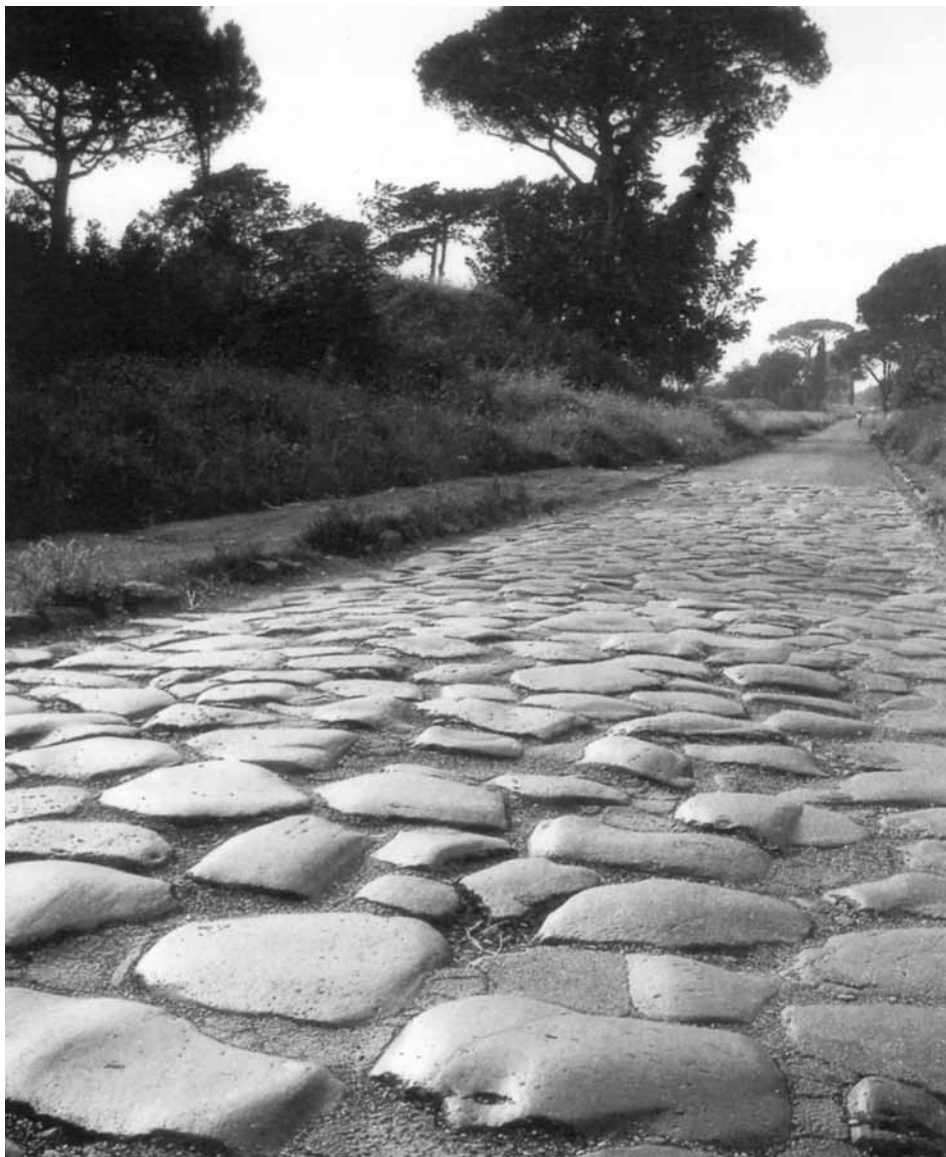
Via Appia Antica

nachträglich zur »römischen Trilogie« gebündelt hat: »Fontane di Roma«, »Pini di Roma« und »Feste Romane«. Das mittlere, den Pinien Roms gewidmete Stück ist eine Tondichtung und viersätzig wie die beiden anderen programmatischen Rom-Werke von Respighi. Und wie diese erzählt »Pini di Roma« keine Geschichte, die man in Worten nacherzählen könnte, sondern schildert Situationen. Im ersten Stück sind es die spielenden