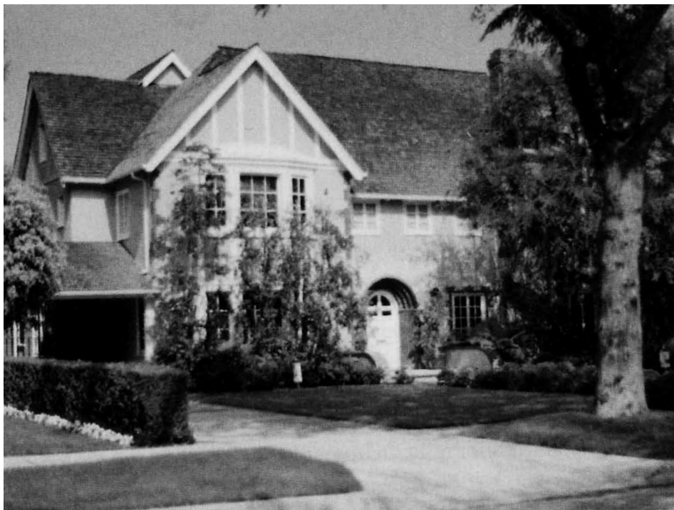
Das letzte Haus: Beverly Hills, 610 Elm Drive