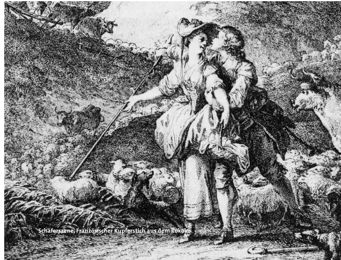
Schäferszene, Französischer Kupferstich aus dem Rokoko

Maurice Ravel über »Daphnis et Chloé« in »Esquisse autobiographique«