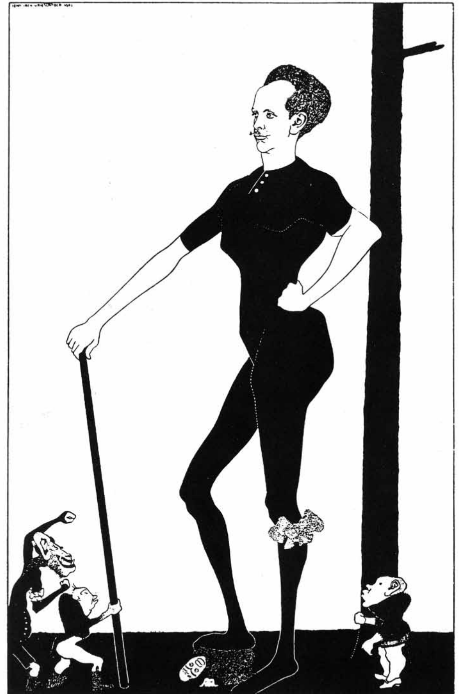
Des Helden Widersacher, aus der Berliner Musik -und Theaterzeitung 1902