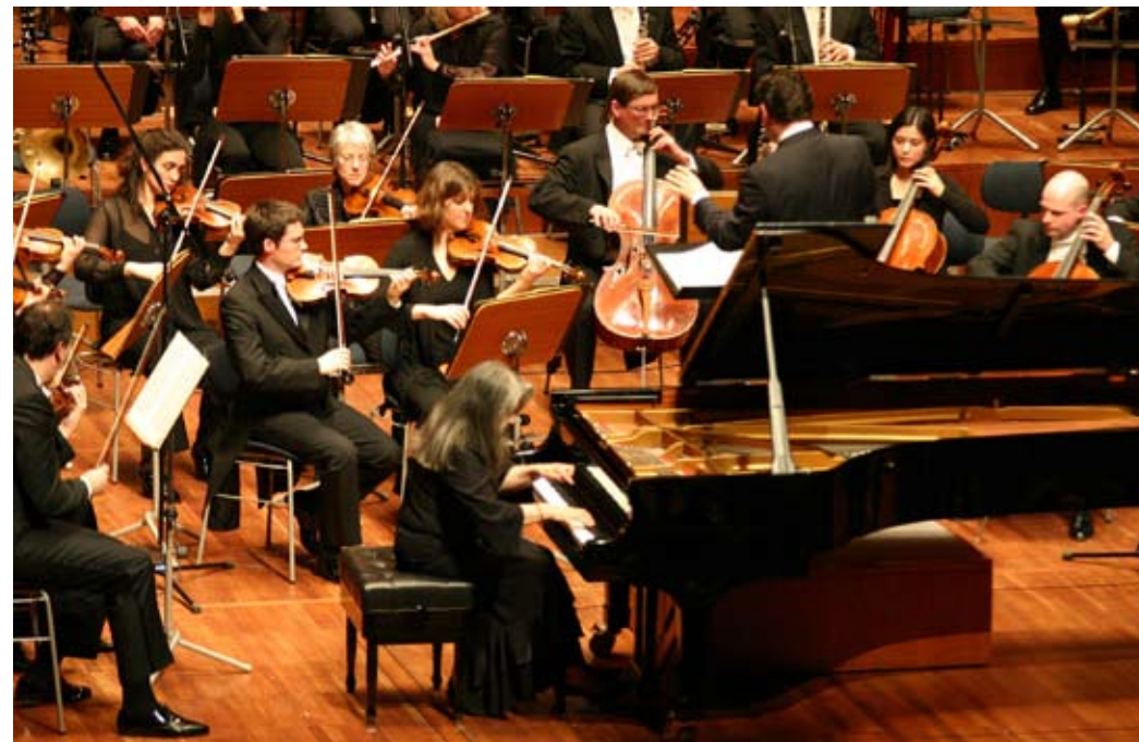
Martha Argerich und das SWR Sinfonieorchester mit Tugan Sokhiev - Konzerthaus Freiburg, 23. Januar 10

Unterdessen hat gestern Sylvain Cambreling, Chefdirigent des SWR Sinfonieorchesters, in Cannes den Midem Classical Award für die Kategorie Neue Musik entgegengenommen. Damit ist die Gesamtaufnahme der Orchesterwerke Messiaens auf acht CDs, die schon den Jahrespreis der Deutschen Schallplattenkritik erhielt, eine der erfolgreichsten Produktionen in der Geschichte des SWR Sinfonieorchesters. Midem steht übrigens für „Marché international de l'édition musicale“, es ist die größte Musikmesse der Welt mit 8000 Besuchern. Um so bemerkenswerter, dass von den sechzehn Preisen für Novitäten der „Klassik“ sechs an Labels und Musiker aus Deutschland gehen. Die Produktionsbedingungen hierzulande sind offenbar selbst in Krisenzeiten weltweit ohne Konkurrenz. Den deutschen Rundfunk hat Sylvain Cambreling einmal schlichtweg als „beste Organisation für Musik in ganz Europa“ bezeichnet – auch das kann man im Votum der Jury bestätigt sehen.