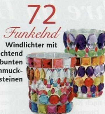
72 Funkelnd Windlichter mit leuchtend bunten Schmucksteinen