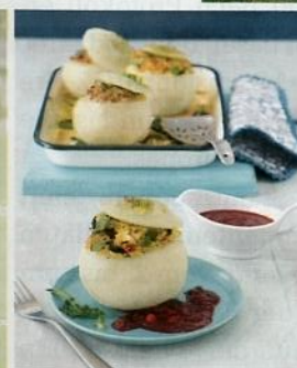
20 Gerichte von unseren Profis