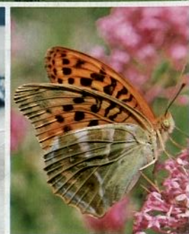
62 Zartes Wesen Schmetterling