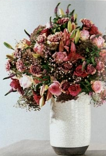
50 Duftendes Ensemble: Rosen, Lilien und Nelken