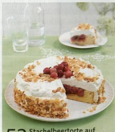
52 Stachelbeertorte auf