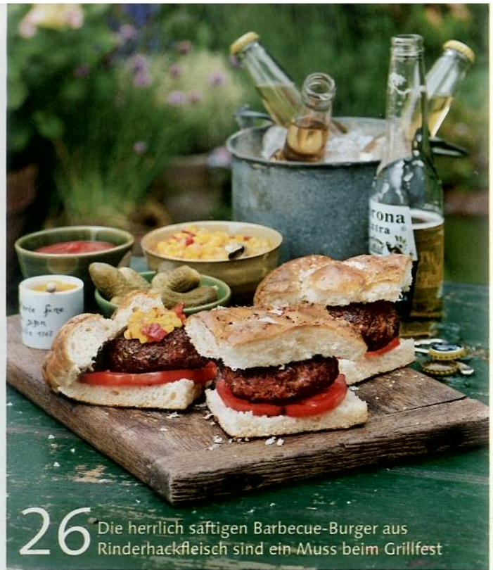
26 Die herrlich saftigen Barbecue-Burger aus Rinderhackfleisch sind ein Muss beim Grillfest